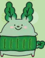
JA佐伯中央 オリジナルキャラクター 「そう君」