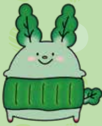
JA佐伯中央 オリジナルキャラクター 「そう君」