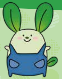
JA佐伯中央 オリジナル キャラクター 「なっちゃん」